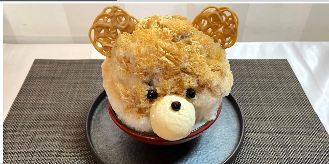
WA!!くまのかき氷 2,200円(税込/サ別)

黒糖シロップと特製練乳ミルクベースの和テイストなかき氷です。かき氷の中にはあずきやかりんとうが入っており様々な食感が楽しめます。さらに食べ進めると抹茶のかき氷やぶるぶるの食感の抹茶プリンが現れます。ひとつのかき氷で様々な食感とテイストを味わえる、まさに「WA!」と驚きながらながら楽しめるかき氷です。