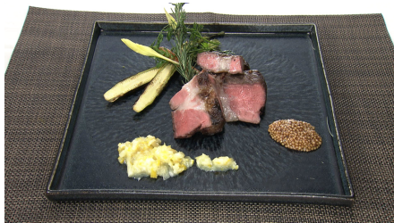
十勝ロイヤルマンガリツア豚のロースト 塩麴レモン 6,800円(税込/サ別)

熟成させ旨味が凝縮されたさつま牛福永を炭火でじっくりと焼き上げました。バター、レモン果汁、卵黄に加え、鰹出汁を入れて和風仕立てにしたオリジナルのオランダーズソースに、濃厚で深みのある味わいの愛媛の梶田醤油をかけてお召し上がりいただくことで、洋風すき焼きのような味わいを楽しむことのできる一皿です。