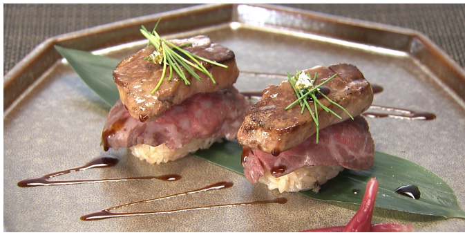
田村牛のロッシーニ The Place of Tokyo スタイル 1貫 2,500円(税込/サ別)

『ゴチになります！』番組内でスペシャルメニューとして紹介された一品です。数々の賞を受賞している最高品質の田村牛を低温でローストビーフにし、少価値の高いフォアグラ、トリュフ薫るデュクセルを重ねました。婚礼料理の看板商品である“フォアグラのソテー お寿司仕立て”から発案されたオリジナルメニューです。