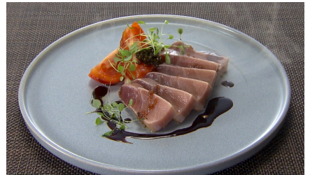
焼津産 マグロ中トロの瞬間燻製 キャビアと共に 6,000円(税込/サ別)

日本一の品質といわれる肉厚で柔らかい京筍と、厳選した大粒の地蛤と共に炊き上げたりゾットです。落味噌を入れることで春らしい香りとほろ苦さがアクセントになった一品です。