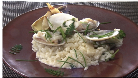
九十九里浜 地蛤と京筍のリゾット 落味噌仕立て 3,000円(税込/サ別)

ハンガリーの国宝に認定されているマンガリツア豚を十勝の地で育てあげた、希少価値が高い豚肉です。まるで牛肉の様な赤身とサシが特徴で、脂はとろける様なくちどけです。薫り豊かな瀬戸内レモンを塩麴漬けにして発酵させた自家製の塩麴レモンと、えごま入りのマスタードでお楽しみください。