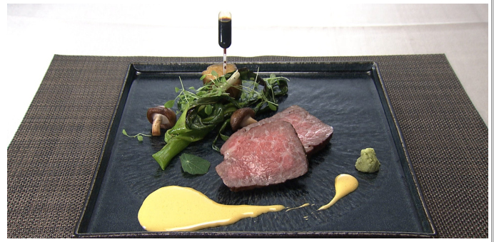
熟成 さつま牛福永のアッブラーチェ すき焼き風 6,300円(税込/サ別)

『ゴチになります！』番組内でスペシャルメニューとして紹介された一品です。数々の賞を受賞している最高品質の田村牛を低温でローストビーフにし、少価値の高いフォアグラ、トリュフ薫るデュクセルを重ねました。婚礼料理の看板商品である“フォアグラのソテー お寿司仕立て”から発案されたオリジナルメニューです。