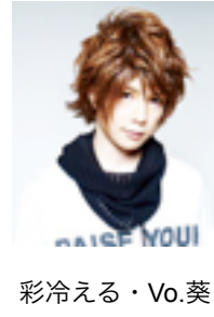
彩冷える・Vo.葵 ※モデル参加のみ