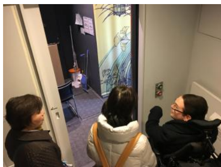
①浅草文化観光センター