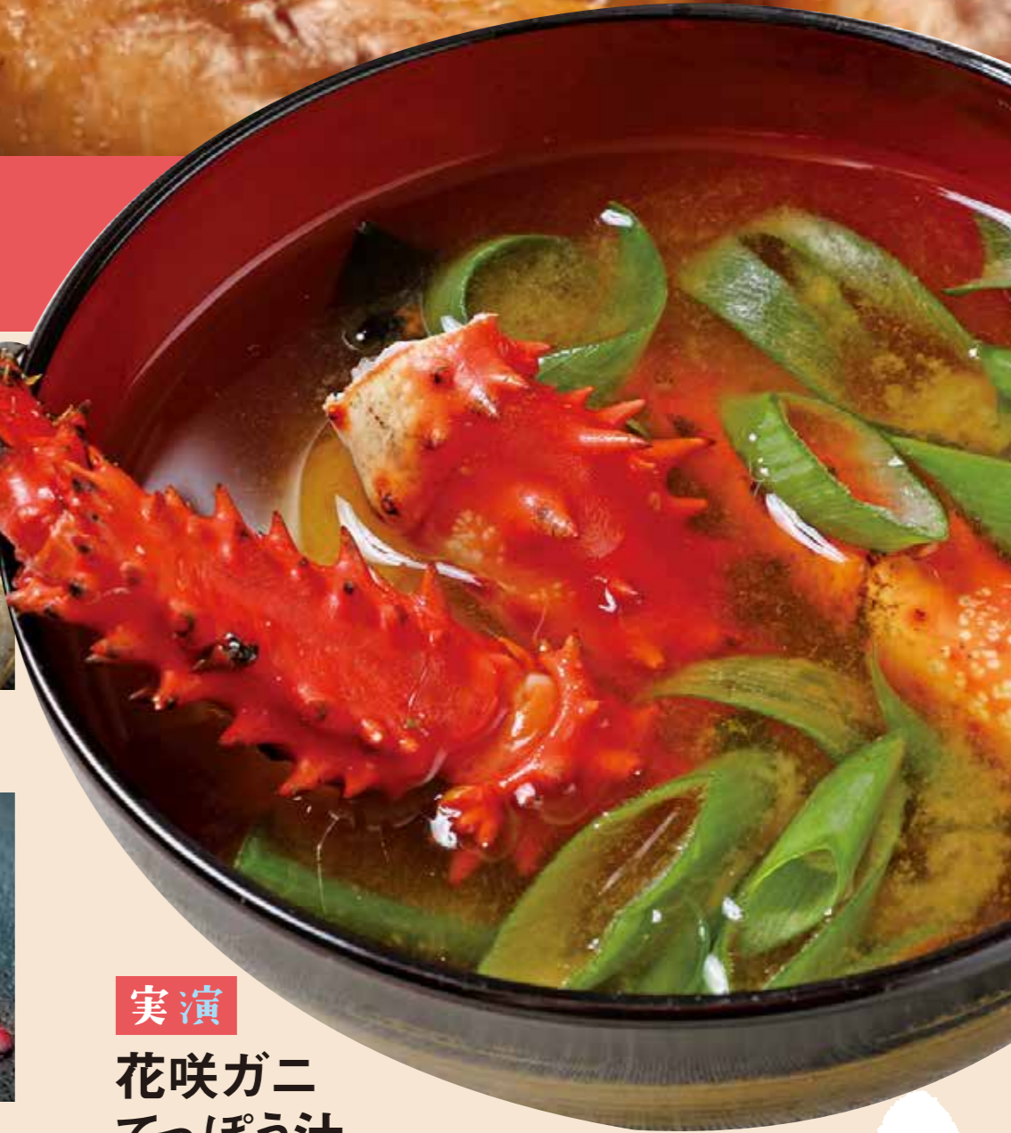
実演 花咲ガニ てっぽう汁

■主催/荒川区 ■共催/北海道釧路地域・東京都特別区交流推進協議会 ■後援/東京都 お問い合わせ 事務局[釧路町村会] ☎ 0154-43-0649