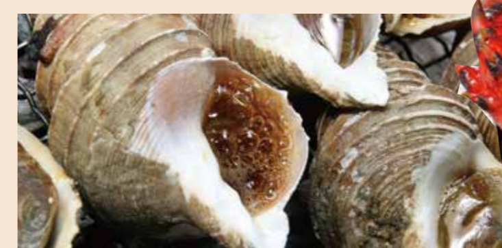
実演 焼き灯台ツブ