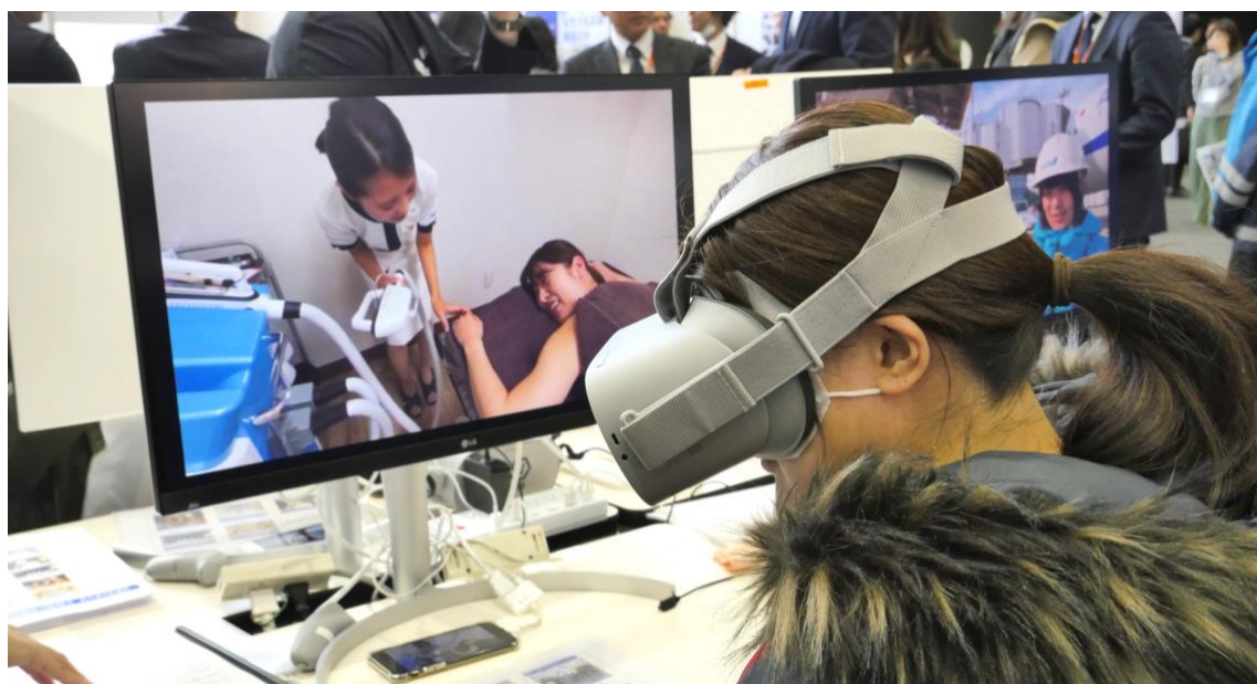
▲第1回「しごとと発見フェア」開催時の『VR しごとと体験』ブースの様子。

医療福祉、小売、製造などを中心に様々な業種の現場研修 VR や採用 VR を手がけるジョリーグッドは、今年1月に秋葉原で開催した「しごとと発見フェア」にて VR しごとと体験による当日面談率 UP を実現しました。この結果を経て第2回目となる「しごとと発見フェア」の開催が決定し、前回人気を博した VR しごとと体験を、今度は東京だけではなく、大阪でも体験展示いたします。