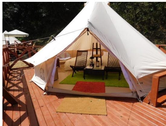
THE FARM CAMP アスレチック

THE FARM CAMP (ザ ファーム キャンプ) は、絶景のロケーションの中で、手ぶらで気軽に楽しめる、新しいキャンプスタイルの施設です。朝は、優雅に開放感溢れるウッドデッキから大自然を眺めながらコーヒーを楽しみ、夜はハンモックに揺られながら、夜空に広がる星の鑑賞など贅沢な雰囲気を楽しめます。さらに、当施設の農園で収穫された新鮮な野菜やお肉などの豪華食材、BBQに必要な機材をご用意。農園では収穫体験もでき、ひと味違ったグランピング&BBQをご体験いただけます。