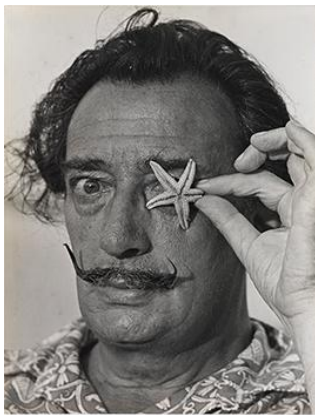
©X. Miserachs/Fundació Gala-Salvador Dalí, Figueres, 2016. Image Rights of Salvador Dalí reserved. Fundació Gala-Salvador Dalí, Figueres, 2016.

国立新美術館にて2016年9月14日(水)～12月12日(月)に開催される「ダリ展」を記念して、9月5日(月)～9月11日(日)までの1週間、ダリのトレード・マークの「ヒゲ」をスタンプできる特別プリントシール機を東京メトロ丸ノ内線新宿駅メトロプロムナードに設置いたします。(参加費無料)