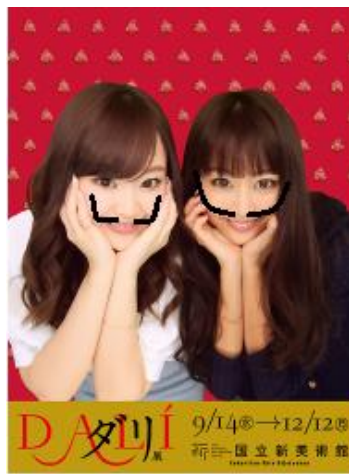
【撮影仕上がりイメージ】