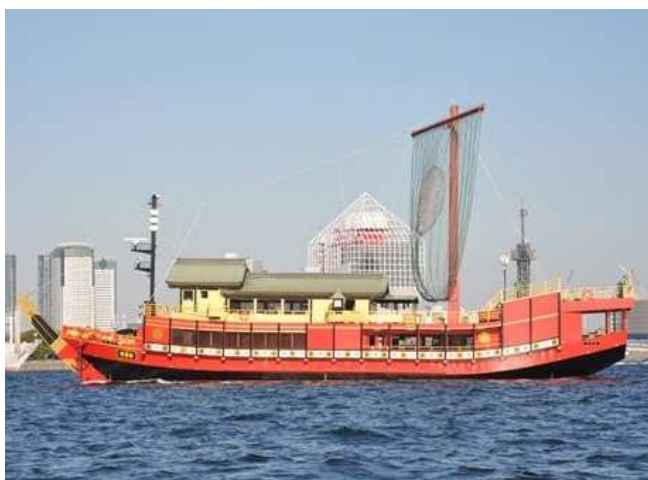
御座船「安宅丸」全景