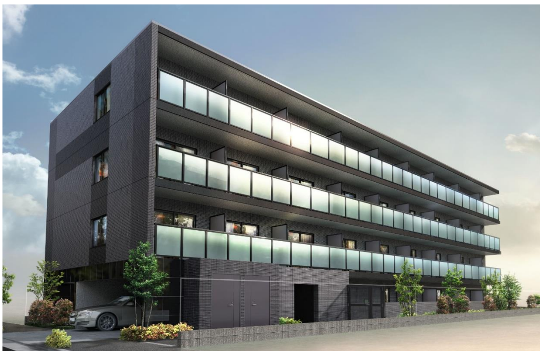
※画像はイメージです。実際の物件とは異なる可能性があります。

投資用不動産を扱う株式会社グローバル・リンク・マネジメント（本社：東京都渋谷区、代表取締役社長：金 大仲、以下、GLM）は、5年連続して入居率99%以上を誇る自社ブランド「 ARTESSIMO（アルテシモ）シリーズ 」の新物件として「 ARTESSIMO® DOUX（アルテシモ デュース） 」の分譲を2019年3月1日（金）より開始します。