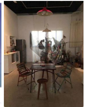
右: 2015年公演「CAKE FOR BREAKFAST」の様子