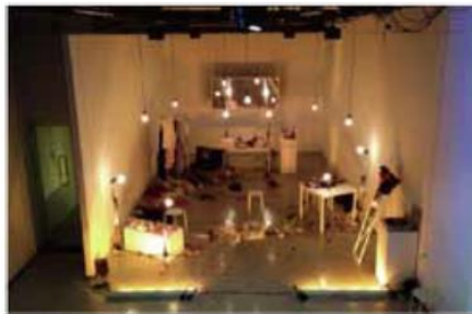
上: 2014年公演「楽屋」の様子