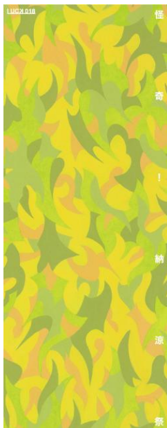
メインビジュアル・ロゴデザイン/植村泰英

株式会社アースプラス（東京都江東区木場／代表取締役：松尾直樹）が運営する、月単位で様変わりする、ギャラリーならではのコンセプトショップ EARTH+gallery shop 『LUCK』（アースプラスギャラリー ショップ ラック／東京都江東区木場）は、2017年7月8日（土）～7月23日（日）の期間、「怪奇！納涼祭」と題して、暑い夏にぴったりの肝から冷える怪談を集めた展覧会を開催致します。