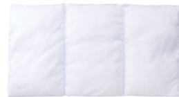
3分割パッドクッションファイバーボール