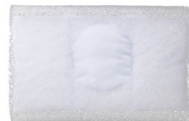
ビューティーピロー(中素材)

後頭部を支える頭部ホールは、首の長さに合わせて二段階対応。パッドの抜き差しにより、枕の高さもご自身で調整が可能です。