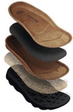
【独自のソール構造】

■ 耐久性 ：天然の高品質な素材、スペインのサプライヤーを使って100%スペインで製造しているフットベッドは、耐久性にも優れています。