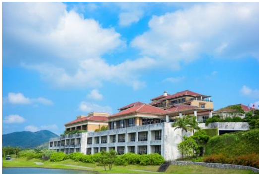
ザ・リッツ・カールトン沖縄 外観イメージ