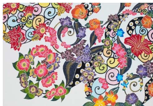
紅型デザイン イメージ