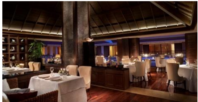
イタリアンレストラン ちゅらぬうじイメージ

本年5月28日に開業5周年を迎える、「ザ・リッツ・カールトン沖縄（所在地：沖縄県名護市喜瀬 1343-1 総支配人：吉江 潤）」では、日頃よりご愛顧いただいておりますお客様への「感謝」の気持ちと、これからご愛顧いただきたい皆様への「想い」を込め、さまざまなプロモーションを実施しております。