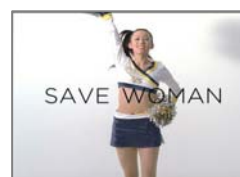
栃木県 TOMOEさん 25歳 チアリーダー