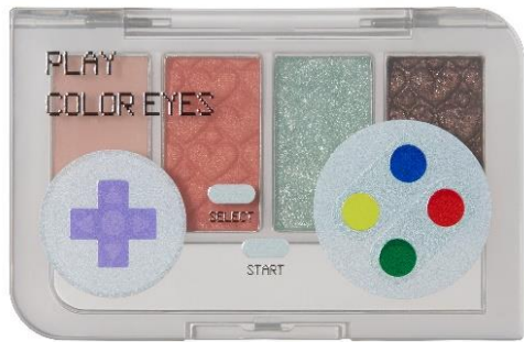
ディアマイキスグラミー