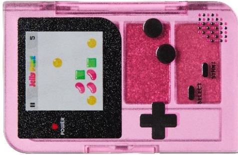
ゴージャスグローリーライト