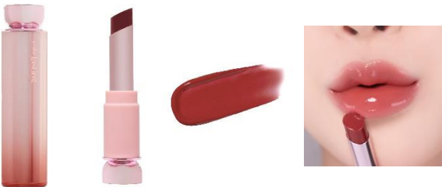
はちみつベージュ ドライフラワーのような 深みのあるベージュローズ