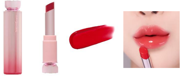
永遠ルビー 鮮やかな蛍光レッド