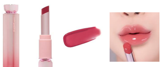
ピンクの願い 愛らしいヌードピンク