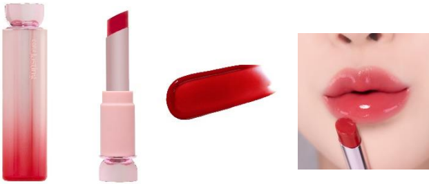
やきもちレッド コーラルローズレッド