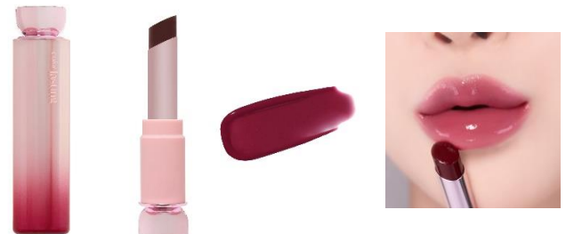
夜明けモーヴ ドリーミーダークモーヴ