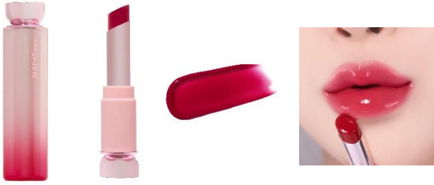
いちごローズ 抜け感のあるさわやか チェリーレッド