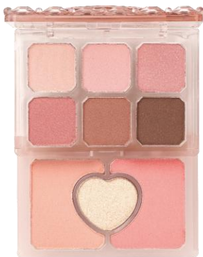
02 休日のモモパフェ