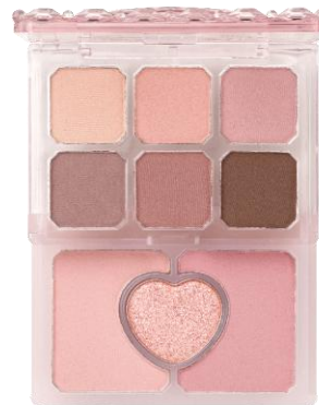
03 食後のイチジクタルト