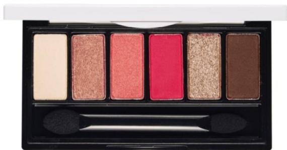
#マゼンタドロローイング