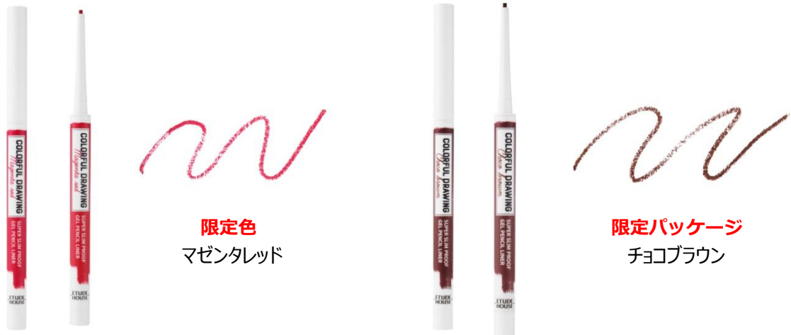
限定色 マゼンタレッド

敏感な目元に負担を感じさせない、なめらかなジェルタイプ。一度のタッチで溶け込むようにフィットし、鮮やかに発色します。汗・水・皮脂に強いウォータープルーフなので、崩れにくい美しいメイクを長時間保ちます。速乾タイプでまばたきをしても色移りしにくく、お出かけ前や外出先でのメイクにもオススメです。