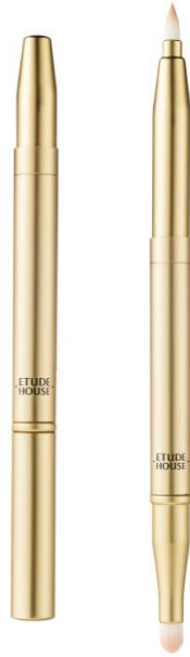
カラフルドローイング デュアルリップブラシ