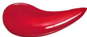
限定色 PK007 カリニョピンク