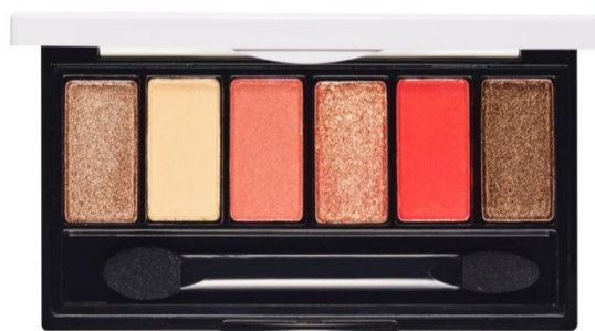
#ヴァーミリオンドロローイング