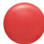
OR205 アプリコットバー