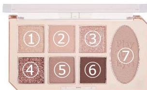
ヌードミルクティー