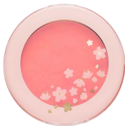
PK001 太陽浴びた満開の桜