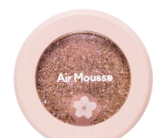
BR404 ドキドキピクニック