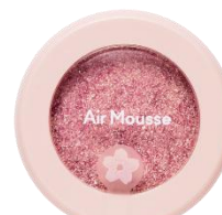
PK002 ルンルンお出かけ