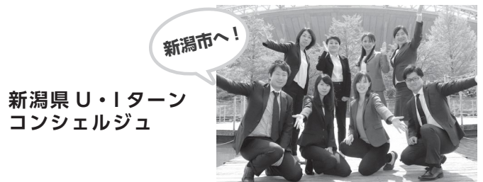
新潟県U・Iターン コンシェルジュ

新潟県U・Iターンコンシェルジュは、あなたが希望するU・Iターン転職を実現するためのエージェントです。転職のプロとして、あなたのご希望に合った求人の開拓、企業とのマッチングを全て無料で行うなど、U・Iターン転職に必要な情報もあわせて提供いたします。