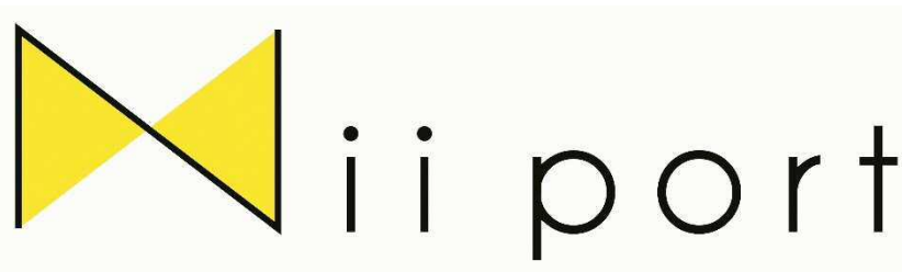
Nii port ロゴマーク

新潟開港 150 周年記念事業実行委員会では、「みなとまち新潟」らしさ×新しさを体現するブランド「Nii port」を立ち上げました。今後、新潟に所縁のある企業・団体や学生など様々な方にご協力いただき、「みなとまち新潟」の魅力をカタチにするモノ・コトを開発していきます。