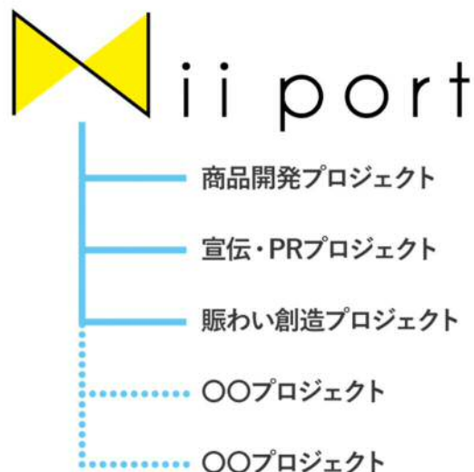
Nii port の取り組み

展開は、記念事業期間の 2019 年 12 月までですが、多くの方にご支持を得たり喜んで もらったモノ・コトについては、期間終了後も継続し、開港 150 周年以降も続くブラン ドを目指していきます。