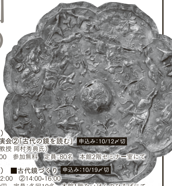
八弁形狩猟紋銀鏡背(唐)

かつて長安と呼ばれ、中国の歴代王朝が都をおいた西安には、時の権力者に重んじられた品々が数多く残っています。なかでも玉製品と鏡は、霊的な力をもつと考えられ、装飾品・実用品のほか祭祀や埋葬にも用いられました。 このたび、西安博物院と新潟市歴史博物館の友好提携一〇周年と新潟開港一五〇周年を記念し、西安博物院のコレクションから貴重な玉製品と鏡八〇点を展示します。古代中国の歴史をひも解きながら、玉と鏡に求められた神秘の力をさぐります。