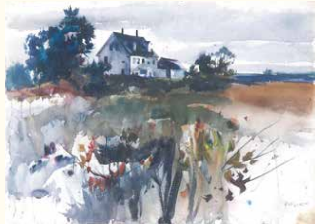
a / 《クリスティーナの世界》習作 1948年 水彩・ドライブラッシュ、紙 b / 《納屋のツバメ》(《さらされた場所》習作) 1965年 水彩・鉛筆、紙 c / 《パイ用のブルーベリー》習作 1967年 水彩、紙 d / 《オルソンの家の秋》1941年 水彩、紙