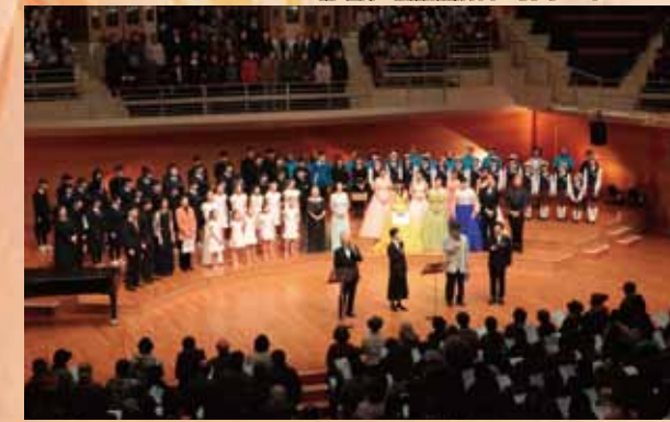
第9回千の風音楽祭(りゅーとぴあコンサートホール)