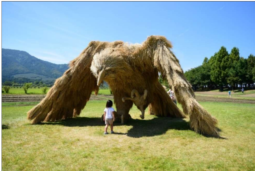
「稲わらを使って作った巨大なオブジェ」（昨年度の作品）

米どころ西蒲区の広大な田園で育った黄金色の稲わらから生まれるわらアート。迫力満点の5体の野獣たちのフェスティバルを9月2日・3日に上堰潟公園で開催します。ステージイベントや特産品販売、体験コーナーなど楽しみどころ満載。開催10回目の今年は動画共有サイト niconico の公式イベント「ニコニコ町会議」も同時開催されます。お楽しみに！