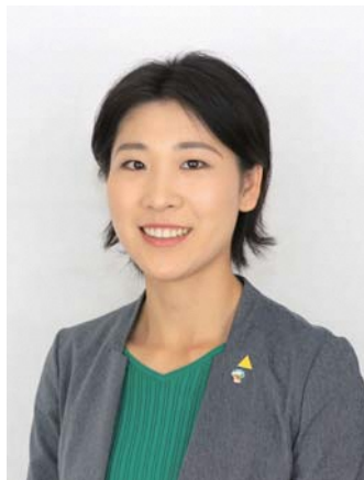
桑原 悠 津南町長