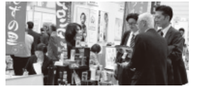
※写真は全て6次化フェア2016のものです

A-FIVE(株)農林漁業成長産業化支援機構が運営する「6次産業化中央サポートセンター」のプランナーによる相談コーナーを開設。ご来場の6次産業化を目指す事業者の相談に無料で応じます。