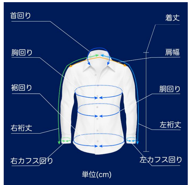
画像採寸 イメージ

この度、東京大学発のベンチャー企業Arithmer株式会社(アリスマー)との技術協力のもと、オーダースーツブランド「DIFFERENCE」立ち上げ当時から準備を進めていたAIを活用した画像採寸アプリを開発いたしました。普段のシャツとパンツで、4枚の写真と数項目入力するだけで、商品の出来上がりサイズを提案する画期的な無料のアプリのサービスです。