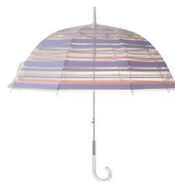
【商品名】 ブリュイ フラワー ビニール傘 58cm ブラウン 【価格】 ¥1,000 (税込)

パープルとクリアのストライプが涼やかな傘。丸みのあるフォルムで人気のバードケージ型は、可愛らしさと濡れにくい機能性を兼ね備えています。