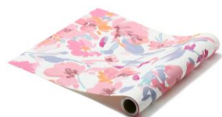
【種類】フロレシア ピンク