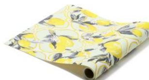
【種類】シトリア イエロー