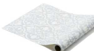
【種類】タイル グレー