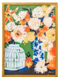
【商品名】ビビッド フラワー アートボード グリーン 【価格】¥10,000 (税込)