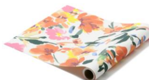
【種類】フロレシア オレンジ