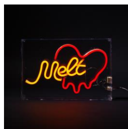
【商品名】アクリル ネオン オブジェ メルト 【価格】¥6,800 (税込)