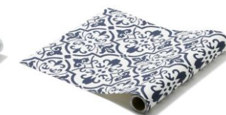
【種類】タイル ネイビー