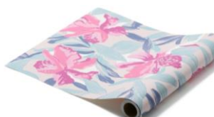
【種類】ポタニカ ベージュ