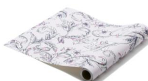
【種類】グラシュ ピンク