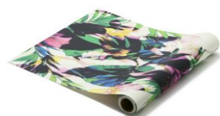
【種類】ジャングル マルチ