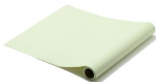
【種類】カラー ライトグリーン