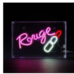
【商品名】アクリル ネオン オブジェ ルージュ 【価格】¥6,800 (税込)