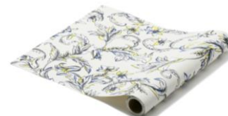
【種類】グラシュ イエロー