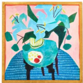
【商品名】ビビッド フラワー アートボード ピンク 【価格】¥10,000 (税込)