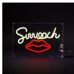
【商品名】アクリル ネオン オブジェ スムーチ 【価格】¥6,800 (税込)