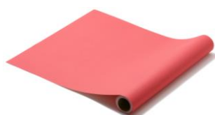
【種類】カラー ダークピンク

(無地：¥2,500 (税込) / 柄：¥2,800 (税込)、サイズ：W45×H250cm)