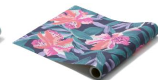
【種類】ポタニカ ネイビー

※価格は全て税込みです。※商品名、価格、仕様、発売期間等は変更される可能性があります。