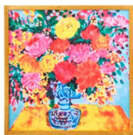
【商品名】ビビッド フラワー アートボード ブルー 【価格】¥10,000 (税込)

※価格は全て税込みです。※商品名、価格、仕様、発売期間等は変更される可能性があります。