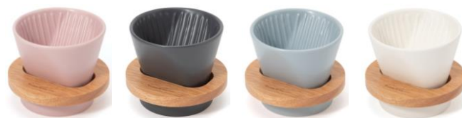
【商品名】マリオン ドリッパーセット 【カラー展開】ピンク / グレー / ミント / アイボリー 【価格】 ¥1,200

マリオンマグとおそろいで使えるドリッパーセットです。マリオンマグのマットな質感とウツの温かみを取り入れたデザインがポイントです。ドリップ後にドリッパーを置けるトレーもセットになっています。トレーは小さめのボウルとして、角砂糖やお菓子を入れて楽しむ事も出来ます。箱入りで、マリオンマグと合わせてギフトにするのもおすすめです。