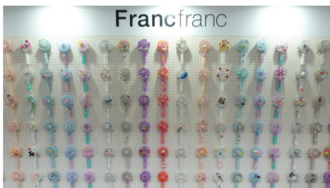
約400点のデコったフレ ハンディファンを展示

会場には約400点のデコった「フレ ハンディファン」が登場！SNS投稿で限定パーツセットをゲットしてその場で簡単にデコレーション体験