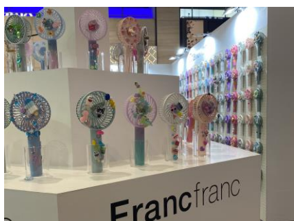
かわいいデコファンをピックアップ