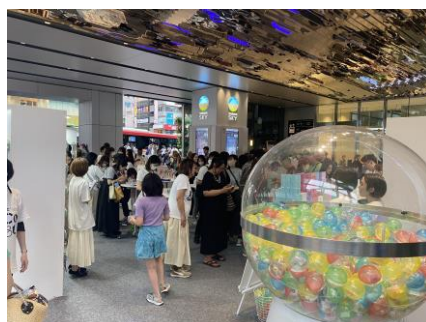
初回イベントの様子(東京・渋谷)