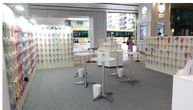
ミニデコブースで簡単にデコレーション体験可能