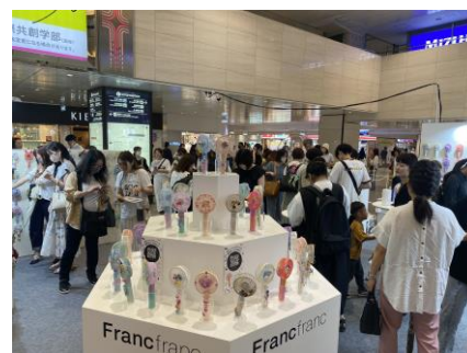
大阪イベントの様子(大阪・梅田)