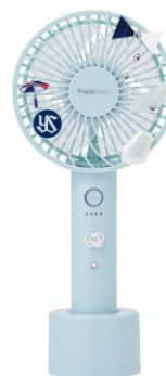
【商品名】Passion TEAM COOL モデル C 【価格】 ¥ 3,500

「フレ ハンディファン東京ヤクルトスワローズデコレーション」モデル (7月13日(木) 公開予定) https://francfranc.com/pages/decolabo-swallows