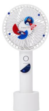
【商品名】Passion TEAM MOON モデル A 【価格】 ¥ 3,500

Francfranc オンラインショップにて7月13日(木)より販売開始する東京ヤクルトスワローズ公式ダンスパフォーマンスチーム『Passion (パッション)』のメンバーが3チームに分かれて「つば九郎」や「つばみ」モチーフなど『東京ヤクルトスワローズ』ならではの限定パーツでデコレーションした限定モデルのレプリカをイベント会場で展示いたします。