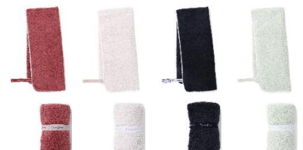
【商品名】ジムタオル ミニバスタオル 【種類】ピンク/ライトピンク/ネイビー/ミント 【価格】各¥1,400

吸水性と速乾性に優れたマイクロファイバー素材のタオルです。肩にかけやすいサイズのバスタオルなのでトレーニング後のタオルとしておすすめです。シャワールームで引っかけて使えるゴムバンド付きです。