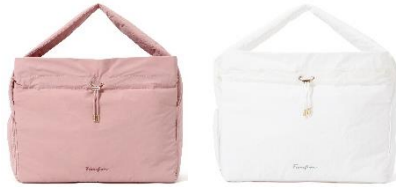
【商品名】ロゴ ジムバッグ 【種類】ピンク/ホワイト 【価格】各¥6,900

濡れたものを安心して収納できる防水ポケットやシューズポケット、ヨガマットホルダーなど、ジムやフィットネス通いに特化した機能を備えたバッグです。トレンド感ある素材やカラーなのでファッションバッグのように洋服にも合わせやすく、会社や学校に持っていきやすいデザインが嬉しいポイントです。