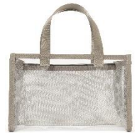
【商品名】クリア スパバッグ 【種類】ピンク/グレー 【価格】各¥2,200

ジムやスパ通い、旅行にもおすすめのスパバッグです。通常サイズのシャンプーやハンドタオルが入る収納力が魅力です。メッシュ素材なので、濡れても水切れがよく使いやすい仕様です。