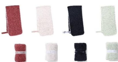
【商品名】ジムタオル ミニフェイスタオル 【種類】ピンク/ライトピンク/ネイビー/ミント 【価格】各¥900

吸水性と速乾性に優れたマイクロファイバー素材のタオルです。コンパクトに持ち運びやすいサイズなので、ジムでトレーニングする際の汗拭きタオルとしておすすめです。シャワールームで引っかけて使えるゴムバンド付きです。