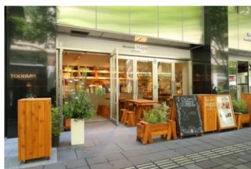
<Marunouchi Happ. Stand & Gallery>

「Marunouchi Happ. Stand & Gallery」は、ポップアップギャラリーとフードスタンドが融合した、丸の内仲通りにある小さなカフェスタンドです。そこは、雑誌のように次々とテーマが入れ替わる POP UP GALLERY。毎回、何が起きるか分からないドキドキを届けます。傍らには、仲通り「アーバンテラス」の拠点としてデイリーユースに立ち寄れる FOOD STAND。旬な野菜がたっぷり詰まった手作りサンドイッチ。熟練の醸造家が丹精込めて仕込むクラフトビール。原産地の個性を大切に自家焙煎したスペシャルティコーヒー。毎日、「ちゃんと美味しい」ものを変わず提供します。