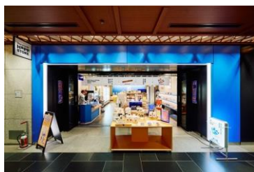
<Marunouchi Happ. STORE>

「Marunouchi Happ. Stand & Gallery」の系列店舗として「Marunouchi Happ. STORE」を2024年2月8日（木）にオープンし、「コーヒー（ドリップバッグ）・クラフトビール・本」を軸に、就業者の日常の拠りどころになるような商品や、エリアで開催されるイベントと連動したグッズ、オリジナルの丸の内土産等を企画販売する丸の内発のローカルデイリーストアです。思わず仕事の合間や仕事終わりに立ち寄りたくなるような要素を多数ちりばめ、ホッと一息ついていただけるようなスポットを目指しています。