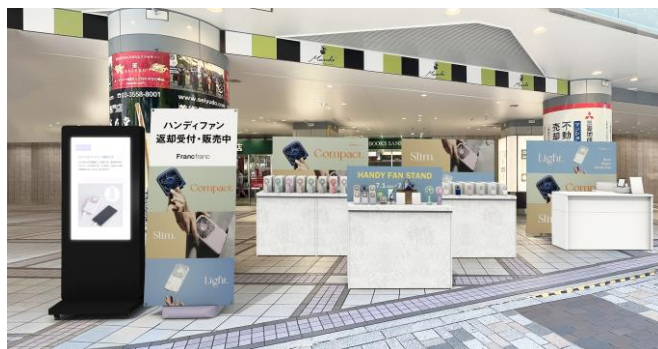
<東京交通会館 イメージ>