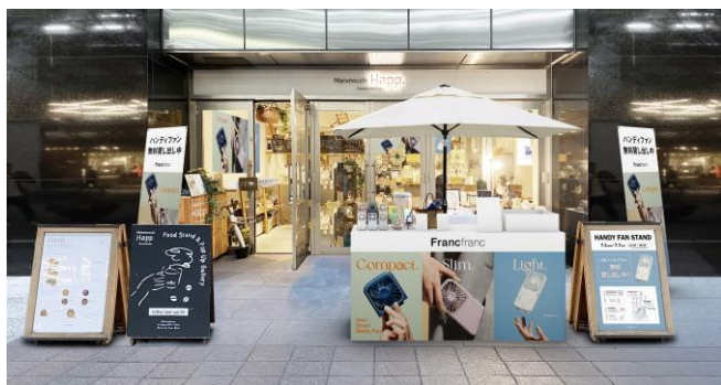
<Marunouchi Happ. Stand & Gallery イメージ>

ハンディファンを無料で借りて涼しさを持ち歩きながら丸の内・有楽町エリアの街歩きを楽しめる体験型イベントです。ブランドショップでのお買い物やカフェタイムの必携アイテムとして丸の内仲通りの新しい楽しみ方をご提案します。イベントでは、ハンディファンの累計販売台数が350万台を突破したFrancfrancが作る、見た目も機能もさらにスマートになった次世代型ハンディファン「フレ スマートハンディファン」を翌日まで無料でご使用いただけます。イベントの拠点となる丸の内仲通りのカフェ『Marunouchi Happ. Stand & Gallery (マルノウチ ハップ スタンド&ギャラリー)』と有楽町の『東京交通会館』では、ハンディファンを購入することもできます。是非、この機会に持ち歩ける涼しさを体験してください。