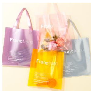
【商品名】クリア トートバッグ 【価格】¥1,000 【種類】8 色展開

今回の POP UP SHOP では「フレ ハンディファン」シリーズのほかにも、これからの季節にぴったりな Francfranc で人気のクリアトートバッグや日傘も販売します。お気に入りのハンディファンとコーディネートして夏のおでかけを快適に楽しくお楽しみください。