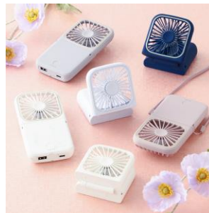
【商品名】フレ スマートハンディファン 【価格】¥2,680～ 【種類】6 色展開

「フレ ハンディファン」シリーズに取り付けることができるネックストラップです。金具を繋げてマルチストラップとしてもお使いいただけます。