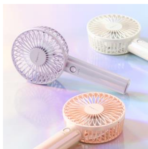
【商品名】フレ ハンディファン 【価格】¥2,680～ 【種類】10 色展開

卓上でも携帯型でも使える USB 充電式 2WAY タイプのハンディファンです。風量 5 段階+リズム風の 6 通りの風量が選べます。