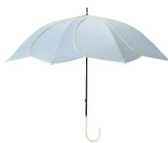
【商品名】バイカラーバイピング 長傘 (晴雨兼用) 【価格】¥2,970 【種類】4 色展開

爽やかなカラーが魅力で、防水仕様なので海やプールなど水場のレジャーに最適なトートバッグです。“中身を見せるバッグ”としてコーディネートを楽しめます。