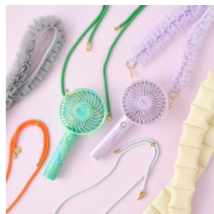
【商品名】フレ ネックストラップ 【価格】¥1,500～ 【種類】9 種類展開

卓上でも携帯型でも使える USB 充電式 2WAY タイプのハンディファンです。風量 5 段階+リズム風の 6 通りの風量が選べます。