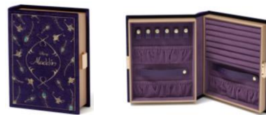
【商品名】MAGIC of CHEMISTRY/アラジン/ブック ジュエリーボックス 【価格】¥8,500

「アラジン」が「ジーニー」にした、一つ目の願い事、「アリ王子」の衣装をイメージしたデザインの、持ち運びに便利なサイズのジュエリーボックスです。