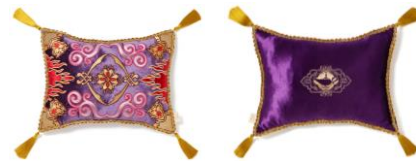
【商品名】MAGIC of CHEMISTRY/アラジン/クッション 【価格】¥5,500

ジャスミンの花やシナモンの香りを調合したスパイシーな香りのフレグランスです。アグラバーの豪華な夜をイメージした、大振りの花がポイントです。ブック型の箱を開くと中扉に物語の 1 ページがデザインされており、開いたページの前にボトルを置けば、物語の世界観を楽しみながら飾ることができます。