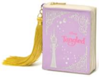
【商品名】MAGIC of CHEMISTRY/塔の上のラプンツェル/ミニポーチ 【価格】 ¥ 2,200

本の形状を模したデザインのチャームとしてもお使いいただけるミニポーチです。リップや小さなアクセサリーなどを収納するのにちょうど良い小振りなサイズです。別売りのトートバッグと組み合わせると本の装丁+本の 1 ページ>のようなコーディネートが楽しめます。