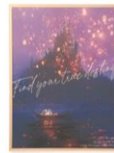
【商品名】MAGIC of CHEMISTRY/塔の上のラプンツェル/アートボード 【価格】 ¥ 4,800 ※オンラインショップ限定

大切なだれかとお揃いで使えるペアスローです。スローを収納するポーチは「ラプンツェル」をイメージしたチュール生地に、「フリン」の身に付けている皮製品をイメージしたタッセルのチャームが付いています。フランネル生地のスローの端には、物語を象徴するモチーフが箔プリントで施されており、繋がるデザインになっています。