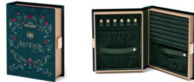
【商品名】MAGIC of CHEMISTRY/アナと雪の女王/ブック ジュエリーボックス 【価格】¥8,500

「アナ」と「エルサ」それぞれの衣装のデザインを取り入れた、持ち運びに便利なサイズのジュエリーボックスです。アレンデール王国のマークをモチーフにしたチャームが付いています。