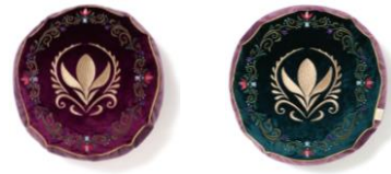
【商品名】MAGIC of CHEMISTRY/アナと雪の女王/クッション 【価格】¥5,500

白樺や凍った湖など、北欧の冬をイメージした香りのフレグランスです。アレンデルの国花であるクロッカスと、銀世界をイメージした大きな白い花を組み合わせました。ブック型の箱を開くと中扉に物語の1ページがデザインされており、開いたページの前にボトルを置けば、物語の世界観を楽しみながら飾ることができます。