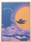
【商品名】MAGIC of CHEMISTRY/アラジン/アートボード 【価格】¥4,800

物語に登場する魔法の絨毯をモチーフにしたインテリアクッションです。劇中で魔法の絨毯が生き物のように動く様子を表現するため、少し湾曲させた動きのある形状がポイントです。刺繍やタッセルなど立体的で豪華な装飾をふんだんに使い、絨毯のリアリティを再現しています。