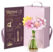
【商品名】MAGIC of CHEMISTRY/塔の上のラプンツェル/フレグランスディフューザー 【価格】 ¥ 4,900

物語の最初の 1 ページをイメージしたデザインのトートバッグです。各作品のストーリーにまつわるモチーフがふんだんに盛り込まれています。大人の女性でも日常使いしやすいよう、落ち着いた高級感あるカラーで統一しています。ノート PC も入るサイズで背面にはジッパーポケットが付いており機能性にも優れています。