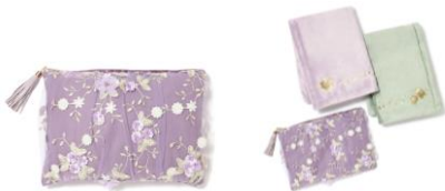
【商品名】MAGIC of CHEMISTRY/塔の上のラプンツェル/ペアスロー 【価格】 ¥ 5,500

劇中、ランタンフェスティバルで「ラプンツェル」と「フリン」がカヌーに乗るシーンをデザインに落とし込んだクッションカバーです。表面は背景のイラストが見えるシフォン素材で、きらきら光るランタンをイメージしています。裏面には「あなたと素晴らしい冒険」という 2 人の気持ちがランタンと共に刺繍されています。