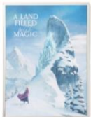
【商品名】MAGIC of CHEMISTRY/アナと雪の女王/アートボード 【価格】¥4,800

※オンラインショップ限定 10月中旬頃入荷予定 「エルサ」をイメージしたスツールです。「エルサ」の優美で冷静な雰囲気を直線的なデザインで表現しています。また、ライトブルーの張り地は、綺麗なアイスブルーの「エルサ」の衣装をイメージしています。