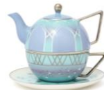
【商品名】MAGIC of CHEMISTRY/アナと雪の女王/ティーフオーワン 【価格】¥6,500

「アナ」と「エルサ」をイメージしたペアマグです。雪の結晶のシャープさを、マグの形状や取手のデザインに落とし込みました。マグの柄はそれぞれの衣装の柄を取り入れたデザインです。