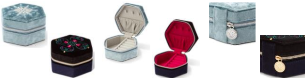
【商品名】MAGIC of CHEMISTRY/トラベルジュエリーボックス S 【種類】アナ/エルサ 【価格】各¥3,800

「エルサ」の魔法で出来上がる氷の城を表現したティーポットとカップ&ソーサーがセットになったアイテムです。物語の象徴的なワンシーンをイメージしています。