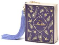
【商品名】MAGIC of CHEMISTRY/アラジン/ミニポーチ 【価格】¥2,200

本の形状を模したデザインのチャームとしてもお使いいただけるミニポーチです。リップや小さなアクセサリなどを収納するのにちょうど良い小振りなサイズです。別売りのトートバッグと組み合わせると「本の装丁+本の 1 ページ」のようなコーディネートが楽しめます。