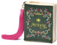
【商品名】MAGIC of CHEMISTRY/アナと雪の女王/ミニポーチ 【価格】¥2,200

本の形状を模したデザインのチャームとしてもお使いいただけるミニポーチです。リップや小さなアクセサリーなどを収納するのにちょうど良い小振りなサイズです。別売りのトートバッグと組み合わせると本の装丁+本の1ページ>のようなコーディネートが楽しめます。