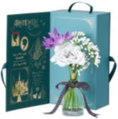
【商品名】MAGIC of CHEMISTRY/アナと雪の女王/フレグランスディフューザー 【価格】¥4,900

物語の最初の1ページをイメージしたデザインのトートバッグです。各作品のストーリーにまつわるモチーフがふんだんに盛り込まれています。大人の女性でも日常使いしやすいよう、落ち着いた高級感あるカラーで統一しています。ノートPCも入るサイズで背面にはジッパーポケットが付いており機能性にも優れています。