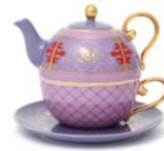
【商品名】MAGIC of CHEMISTRY/アラジン/ティーフォーワン 【価格】¥6,500

「アラジン」の衣装や「ジーニー」をイメージしたペアマグです。取手は「アブー」のしっぽを表現しています。アグラバーの街やアラビアンな雰囲気デザインに落とし込みました。