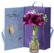
【商品名】MAGIC of CHEMISTRY/アラジン/フレグランスディフューザー 【価格】¥4,900

物語の最初の 1 ページをイメージしたデザインのトートバッグです。各作品のストーリーにまつわるモチーフがふんだんに盛り込まれています。大人の女性でも日常使いしやすいよう、落ち着いた高級感あるカラーで統一しています。ノート PC も入るサイズで背面にはジッパーポケットが付いており機能性にも優れています。