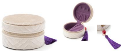
【商品名】MAGIC of CHEMISTRY/アラジン/トラベルジュエリーボックスS 【価格】¥3,800

「アラジン」と「ジーニー」2人の共通の友達であり、劇中の様々な場面で活躍する魔法の絨毯をデザインに落とし込んだ、ティーポットとカップ&ソーサーがセットになったアイテムです。