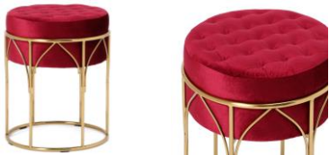
【商品名】MAGIC of CHEMISTRY/アナ/スツール ダークピンク×ゴールド 【価格】¥29,800

アレンデル王国の国旗であるクロッカスの紋章と、繊細な花々の刺繍を施した、北欧の雰囲気を感じられるデザインのインテリアクッションです。「エルサ」と「アナ」の戴冠式の衣装をイメージし、両面をパープルとグリーンのリバーシブルにしています。重厚感があり、インテリアの主役になるアイテムです。