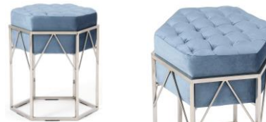
【商品名】MAGIC of CHEMISTRY/エルサ/スツール ライトブルー×シルバー 【価格】¥29,800

※オンラインショップ限定、10月中旬頃入荷予定 「アナ」をイメージしたスツールです。「アナ」のリズミカルな動きや明るい性格を曲線的なデザインで表現しています。また、ダークピンクの張り地は、「アナ」の可愛い衣装をイメージしています。