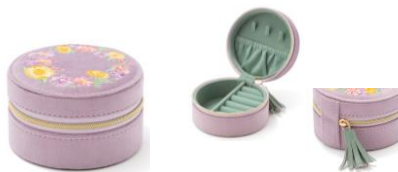
【商品名】MAGIC of CHEMISTRY/塔の上のラプンツェル/トラベ ルジュエリーボックスS 【価格】 ¥ 3,800

ランタンフェスティバルで登場するランタンや、物語のイメージカラーやモチーフなどをデザインに落とし込んだ、ティーポットとカップ&ソーサーがセットになったアイテムです。