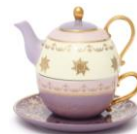
【商品名】MAGIC of CHEMISTRY/塔の上のラプンツェル/ティ ーフォーワン 【価格】 ¥ 6,500

唐草模様をベースに、魔法の花、パスカル、太陽のマークをデザインしたペアマグです。取手は「ラプンツェル」の髪の毛をイメージしています。ランタンを模した円柱型の形状もポイントです。