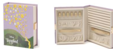
【商品名】MAGIC of CHEMISTRY/塔の上のラプンツェル/ブック ジュエリーボックス 【価格】 ¥ 8,500

「ラプンツェル」の髪飾りをイメージし、繊細な刺繍を施した、持ち運びに便利なサイズのジュエリーボックスです。「フリン」をイメージしたタッセルのチャームが付いています。