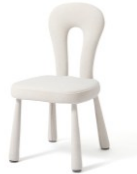
【商品名】レプレ チェア 【種類】ホワイト/ピンク 【価格】各¥ 24,800