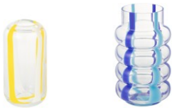
【商品名】ポップストライプ フLOWERベース M・L 【種類】M：イエロー／L：ライトブルー 【価格】M：¥ 3,500／L：¥ 4,000