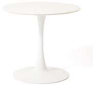
【商品名】デリカ ダイニングテーブル φ80 【種類】ホワイト 【価格】¥ 32,800