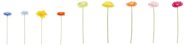
【商品名】アートフラワー ガーベラ S・L 【種類】S：ブルー／ライトブルー／イエロー／オレンジ L：ライトグリーン／イエロー／オレンジ／ライトピンク／ダークピンク 【価格】S：各 ¥ 400／L：各 ¥ 600

オブジェのようなクリアガラスに施したストライプ柄がポップな印象のフラワーベースです。柄と色のニュアンスが一つひとつ異なる一点ものです。ポピーやガーベラなどの色鮮やかなアートフラワーとの組み合わせがおすすめです。