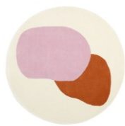
【商品名】ワンダー ラグ ラウンド φ150 【種類】アイボリー×ブルー/ピンク×オレンジ 【価格】各¥ 27,800

デザインが特徴的なラウンドラグです。個性的なグラフィックでダイニングルームのアクセントにおすすめです。アクリル素材を使用しているため、高級感を演出できます。