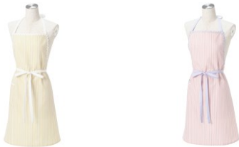
【商品名】ウェーブ フルエプロン 【種類】イエロー／ピンク 【価格】各 ¥ 2,980

トレンド感のあるウェーブのモチーフを胸元にあしらったエプロンです。バイカラーで仕上げたウェーブとストライプがポップな印象で、お料理中の気分をあげてくれます。