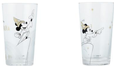
ディズニー ファンタジア ウェーブ グラス ¥1,400 スター グラス ¥1,400

ティーポットとカップ&ソーサーのセットです。ミッキーが魔法をかけているファンタジーなグラフィックで、シルバーで大人っぽく仕上げました。