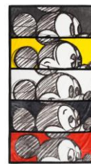
ディズニー GM スロー ¥3,000

各年代のミッキーが並ぶ、特別なデザインのクッションです。コンパクトサイズのロングクッションなので、持ち運んだり、飾ったり様々な用途でご使用いただけます。