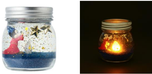
ディズニー ファンタジア フレグランスジェル ¥2,700

『ファンタジア』は1940年に公開されたディズニー長編アニメーション映画。世界初のステレオ音声作品であり、クラシック音楽とアニメーションが融合した名作です。魔法使いの弟子に扮したミッキーが繰り広げる魔法と夢と奇跡の瞬間を切り取り、Francfranc オリジナルデザインで表現しました。