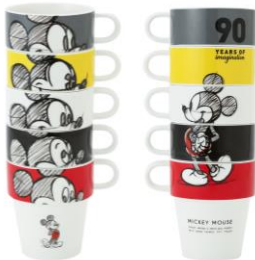
ディズニー GM タワーマグ ¥4,800

1928年から現代までの各年代のミッキーをミックスしてデザインに取り入れた、90周年アニバーサリーイヤー限定柄のFrancfrancオリジナルアイテムを発売します。各年代のミッキーのアートスタイルをお楽しみいただけます。