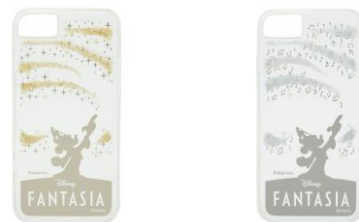
ディズニー ファンタジア ゴールド iPhone ケース ¥3,500 シルバー iPhone ケース ¥3,500

冷たい水を入れると、ミッキーが魔法を使ったように色が浮かび上がり、星の部分が黄色に、波の部分が青く変化するグラスです。グラスの口元を薄く、口当たり良く仕上げました。