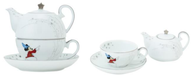
ディズニー ファンタジア ティーフォーワン ¥4,000

ミッキーが魔法をかけているファンタジアの世界観を表現したLEDフレグランスジェル。キャップつきなので外して香りを楽しんだり、香りが不要ないときにはフタをしてLEDライトの優しい雰囲気を楽しめます。 ※発売日：11月上旬予定