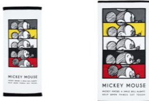
ディズニー GM フェイスタオル ¥1,400 バスタオル ¥3,400

各年代のミッキーの顔が並ぶ、ふわふわの触り心地が気持ちいいマイクロファイバースローです。パッケージにも90周年限定デザインを取り入れたギフトにもおすすめのアイテムです。