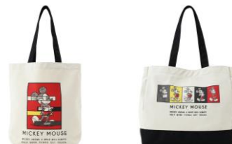
ディズニー GM トートバッグ M ¥3,800 L ¥4,800

各年代のミッキーの顔が並ぶ、フェイスタオルとバスタオルです。タオルとしてだけでなく、壁に飾っていただいたり、イラストを最大限に楽しんでいただけます。