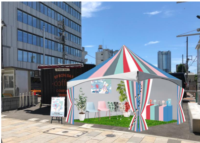
フレ 2WAY ハンディファン POP UP SHOP イメージ

フレ 2WAY ハンディファン POP UP SHOP 特集ページ： www.francfranc.com/frais/