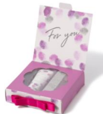
【商品名】ルメッサージュ ハンドケアギフトセット 【種類】全2種 【価格】各 ¥900 (税込)

【おすすめポイント】 香水瓶のようなデザインの ファブリックミスト。ポー チに入るサイズなので、持ち 歩き用にもおすすめです。香 水とは違い、消臭、除菌、抗 菌効果も兼ね備えています。