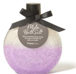
【商品名】ミラ バスソルト 【種類】全3種 【価格】各 ¥1,000 (税込)

【おすすめポイント】 トレンドのミニバッグにも 収まる 140ml 容量のミニボ トル。おでかけの際など、軽 量で持ち運びに便利でエコ、 そしてデザインも豊富で SNS でも人気です。