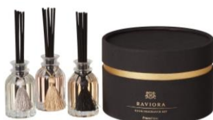
【商品名】ラヴィオーラ ルーム フレグランスセット 【価格】¥3,000 (税込)

【おすすめポイント】 グリッターが入っており、混ぜるときらきらと輝く華やかなルームフレグランス。ギフトに贈りやすいよう、小さめのサイズにしました。