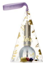
【商品名】ジョワ ネイルオイル 【種類】全3種 【価格】各 ¥880 (税込)

【おすすめポイント】 毎日使うハンカチタオルは いくつ貰っても嬉しいアイ テム。ギフトボックス入りな ので、高見えするのも嬉しい ポイントです。