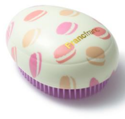
【商品名】ファンファンアンタングルヘアブラシ 【種類】全8種 【価格】各 ¥500 (税込)

【おすすめポイント】 ハートモチーフの入浴剤。お手頃な価格なので、複数まとめてプレゼントするのがおすすめです。お風呂好きの方にセレクトしたいアイテムです。