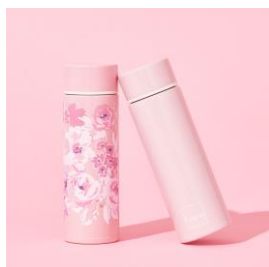
【商品名】シュシュ ミニボトル 【種類】全8種 【価格】各 ¥1,000 (税込)

また、どんな方にも贈りやすいバスアイテムは、見た目から可愛いアイテムをラインアップしました。