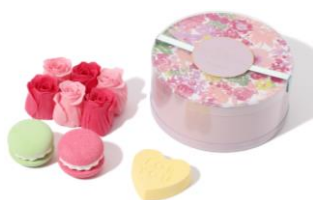
【商品名】プリマ マカロン& ペタルセット 【種類】全2種 【価格】各 ¥1,200 (税込)

【おすすめポイント】 2色のレイヤーが美しいバ スソルト。バスルームいっば いに上品な香りが広がります。 可愛らしい香水瓶をイメ ージしたボトルで、見た目にも 可愛くギフトにぴったりの アイテムです。