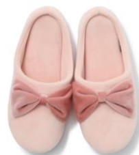
【商品名】モデルヌ ルームシューズ 【種類】全4種 【価格】¥2,400 (税込)

【おすすめポイント】 本物の蠟を用いた、LED キャンドルです。火を使わないため、様々なオケージョンで使用ができ、お子様やペットがいるご家庭でも安心して使用していただけます。