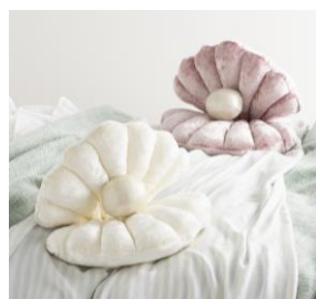
【商品名】シェリル パール クッション 【種類】全3種 【価格】各 ¥2,500 (税込)

【おすすめポイント】 抗菌防臭機能付きで手洗いでできるルームシューズ。パフのような手触りの生地が、足をふんわり包み込んでくれます。心地良さと機能性を兼ね備えているアイテムはギフトとしても喜ばれます。