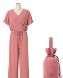
【商品名】トラベルルームウェア オールインワン 【種類】全2種 【価格】各 ¥5,000 (税込)

【おすすめポイント】 ミニボトルにタッセルがついた、大人っぽく上品なフレグランスが入ったセット。3種類入りなので、玄関や寝室、リビングなど場所に合わせて使い分けしていただけます。