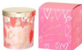
【商品名】カリーノ LED キャンドル 【種類】全2種 【価格】各 ¥2,300 (税込)

いつもお世話になっている方には特別感を伝えるギフトを贈りたい、そんな方に向けて自宅でリラックスタイムに使えるアイテムをセレクトしました。