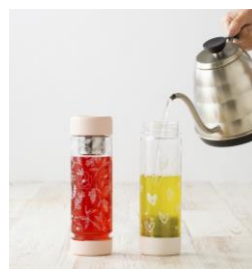
【商品名】シャルロ ティーボトル 【種類】全4種 【価格】各 ¥1,600 (税込)

【おすすめポイント】 マカロン型のバスフィズと、 華やかなフラワーモチーフ のバスペタル、キュートなハ ート型バスフィズの3種類 が入った豪華なセット。満足 感が高いギフトになること 間違いなしです。