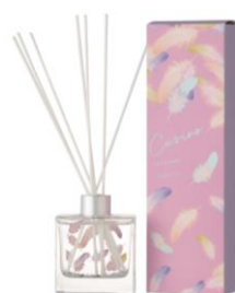
【商品名】カリーノ ルームフレグランス 【種類】全2種 【価格】各 ¥2,800 (税込)

【おすすめポイント】 貝殻モチーフの 2WAY クッションです。そのまま飾っていただいてもフォトジェニックで可愛らしいのですが、真珠形のクッションは取り外しも可能なので、開いて背もたれ用に使用するのもおすすめです。