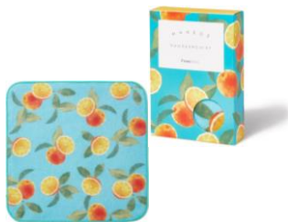
【商品名】マネージュ ハンカチ 【種類】全5種 【価格】各 ¥700 (税込)

【おすすめポイント】 毎日使うハンカチタオルは いくつ貰っても嬉しいアイ テム。ギフトボックス入りな ので、高見えするのも嬉しい ポイントです。