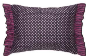
【商品名】まくらカバー フラワーマルチ 【価格】 ¥4,000

ベルベット生地に溢れるような花模様を刺繍したクッションカバーです。華やかなマルチカラーと、ゴージャスなゴールドカラーからお選びいただけます。※初回先行立上店舗のみで展開、9月中旬より全店展開予定