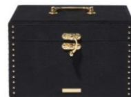
【商品名】 ジュエリーボックス L 【種類】 ダークレッド / ブラック 【価格】 各： ¥10,000