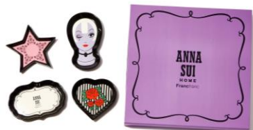
【商品名】ミニプレートセット 【価格】 ¥3,000

ティーポットとカップ＆ソーサーに違う柄を組み合わせ、ANNA SUI の世界観を表現したアイテムです。重ねた時も、それぞれ単体で使用した時もデザインの素敵さが出るように柄の配置にこだわりました。※9月中旬入荷予定