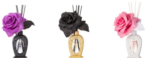
【商品名】 ルームフレグランス 【種類】 ブラック / ゴールド / ホワイト 【価格】 各： ¥4,800

ANNA SUI の香水をイメージし、オリジナルの形にアレンジしたルームフレグランスです。花の部分は長く美しい状態のままお使いいただけるように造花を使用しています。ブラックは ANNA SUI の代表的な香水をオマージュしたローズの香り、ゴールドはスパイシーなローズの香り、ホワイトは甘みのあるローズの香りに仕上げました。※ブラックは 10 月下旬、ゴールド・ホワイトは 11 月下旬入荷予定