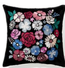
【商品名】クッションカバー フラワー 【種類】 マルチ / ブラック×ゴールド 【価格】 各：¥5,000