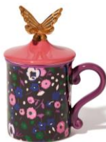
【商品名】フタ付きマグ フラワー ピンク 【価格】 ¥2,200