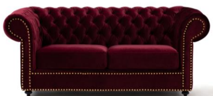
【商品名】ソファ 2シーター ダークレッド 【価格】 ¥149,000