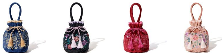
【商品名】 巾着バッグ 【種類】 ネイビー / ブラック / レッド / ピンク 【価格】 各： ￥3,000

巾着と同じバラの刺繍を大胆に施したルームシューズです。足首にかかるリボンベルトが、足を華奢にみせてくれます。