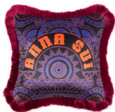
【商品名】クッションカバー ロゴ パープル / レトロフラワー ベージュ 【価格】 各：¥5,000