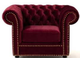
【商品名】ソファ 1シーター ダークレッド 【価格】 ¥79,000