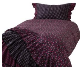
【商品名】掛け布団カバー フラワーマルチ 【価格】 シングル：¥15,000 セミダブル：¥16,000 ダブル：¥17,000