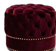
【商品名】オットマン ダークレッド 【価格】 ¥39,000

ANNA SUIらしい美しく曲線的な形状に、上品で肌触りのよいベルベット生地を使用した特別感溢れるシリーズです。深みのあるダークレッドとアクセントのゴールドスタッズが個性的な、今回のコラボレーションを象徴する華やかな仕上がりとなっています。ソファは座り心地にもこだわり、2シーター/1シーターともにゆったりとくつろげるサイズ感です。※全て9月上旬入荷予定