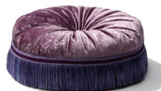
【商品名】クッションΦ50 パープル 【価格】 ¥5,800

Francfranc では定番のフリル仕様の寝具に ANNA SUI コレクションのテキスタイルから4柄を組み合わせプリントした、個性的で華やかな寝具シリーズです。大振りな裾のフレアフリルにそれぞれ異なったプリントを施すことで、奥行き感のあるデザインとなっています。ANNA SUI の世界観にたっぷり浸ることができる寝室を演出します。