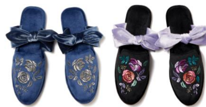
【商品名】 ルームシューズ 【種類】 ネイビー / ブラック 【価格】 各： ￥4,000

ANNA SUI のプリントが全面に施されたルームウェアです。ペロアのボウタイやレースが施されたベルスリーブなど細部までこだわったおうち時間も楽しんでいただける一着です。同柄の巾着バッグ付き。