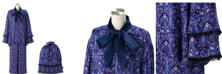
【商品名】 ルームウェア ネイビー 【サイズ】 トップス：着丈 70 cm 身幅 56 cm / パンツ：丈 90 cm ウエスト 64 cm 【価格】 ￥10,000

ANNA SUI のプリントが全面に施されたルームウェアです。ペロアのボウタイやレースが施されたベルスリーブなど細部までこだわったおうち時間も楽しんでいただける一着です。同柄の巾着バッグ付き。