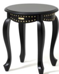
【商品名】サイドテーブル ブラック 【価格】 ¥39,000

ANNA SUIらしい美しく曲線的な形状に、上品で肌触りのよいベルベット生地を使用した特別感溢れるシリーズです。深みのあるダークレッドとアクセントのゴールドスタッズが個性的な、今回のコラボレーションを象徴する華やかな仕上がりとなっています。ソファは座り心地にもこだわり、2シーター/1シーターともにゆったりとくつろげるサイズ感です。※全て9月上旬入荷予定