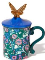
【商品名】フタ付きマグ フラワー ブルー 【価格】 ¥2,200