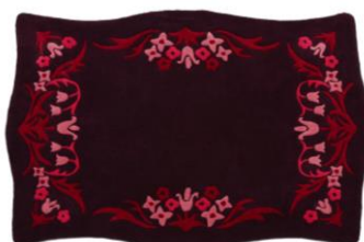
【商品名】ラグ M (140cm×200cm) ダークパープル 【価格】 ¥35,000

曲線的な脚部とゴールドスタッズの装飾が個性的な ANNA SUI の世界観を凝縮したデザインのサイドテーブルです。ポイントに小さなロゴプレートをあしらひ、コラボならではの特別感を演出します。