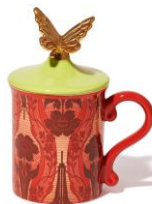
【商品名】フタ付きマグ レース フラワー レッド 【価格】 ¥2,200