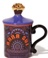
【商品名】フタ付きマグ ロゴ パープル 【価格】 ¥2,200