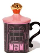
【商品名】フタ付きマグ ストア ピンク 【価格】 ¥2,200

ANNA SUI のアイコン的な蝶やバラのモチーフを立体で取り入れたフタに、ANNA SUI のストアデザインや花柄のデザインのマグがキャッチーなフタ付きマグです。それぞれのマグで使用しているデザインを取り入れた、こだわりのパッケージもポイントでギフトにもおすすめです。※9月中旬入荷予定