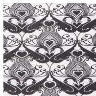
【商品名】リムーバブル ウォールペーパー 【種類】 フラワーパープル / フラワーピンク / スワンブラック 【価格】 各：3,200

貼って剥がせるシールタイプのウォールペーパーです。その日の気分次第で簡単に張り替えができて、ANNA SUIの世界観を手軽にインテリアに取り入れる事が出来ます。また、スワンブラック柄はANNA SUIのブティックで使用されている壁紙と同デザインです。一枚貼るだけで、ご自宅でブティックの雰囲気再現いただけるのが魅力です。