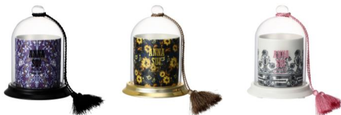
【商品名】 キャンドル 【種類】 ブラック / ゴールド / ホワイト 【価格】 各： ¥3,800

ANNA SUI の香水をイメージし、オリジナルの形にアレンジしたルームフレグランスです。花の部分は長く美しい状態のままお使いいただけるように造花を使用しています。ブラックは ANNA SUI の代表的な香水をオマージュしたローズの香り、ゴールドはスパイシーなローズの香り、ホワイトは甘みのあるローズの香りに仕上げました。※ブラックは 10 月下旬、ゴールド・ホワイトは 11 月下旬入荷予定