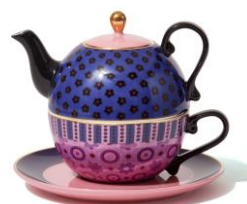
【商品名】ティーフォーワン 【種類】 パープル / グリーン 【価格】 各： ¥5,000