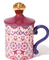
【商品名】フタ付きマグ レトロ フラワー ベージュ 【価格】 ¥2,200