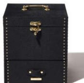
【商品名】 マルチボックス 【種類】 ダークレッド / ブラック 【価格】 各： ¥9,500

ANNA SUI シリーズのスタッズ付き家具から着想を得たデザインのジュエリー・マルチボックスです。スタッズに合わせたメタルパーツやロゴプレートが高級感をさらに引き立てます。内側には ANNA SUI オリジナルのプリント柄を施していて、開けたときに華やかなデザインが特徴です。デザインだけでなく収納力も抜群なので、ジュエリーだけでなく時計など身の回り品も一緒に収納することができます。マルチボックスはかさばり易い化粧水などのスキンケアアイテムも、綺麗に使いやすい形で収納可能でミラーも3段階の角度に調整することができます。