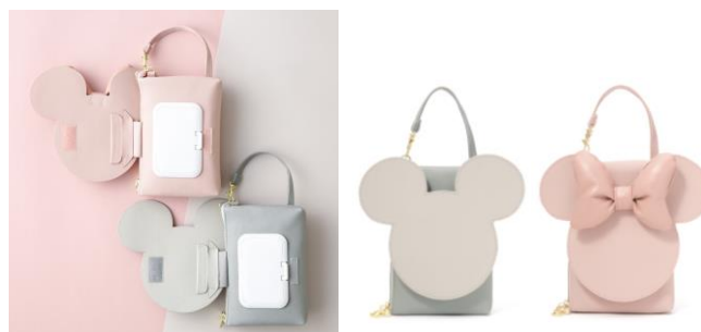
【商品名】ディズニー ウェットティッシュ&マスクポーチ 【種類】グレー/ピンク 【価格】グレー：¥2,400/ピンク：¥2,500

くすみカラーが大人可愛いミッキー、ミニーのモチーフポーチです。ミニーのリボンは柔らかい合皮を使い立体的に仕上げ可愛さをプラスしました。