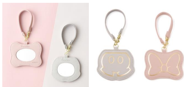
【商品名】ディズニー モチーフミラー 【種類】グレー/ピンク 【価格】¥1,300

リボン・パンツのモチーフをかたどった、ティッシュポーチです。リップなどの小さめのアイテムを入れることもできます。