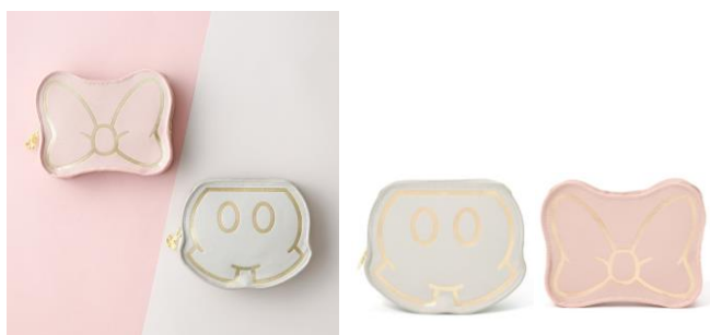
【商品名】ディズニー モチーフティッシュポーチ 【種類】グレー/ピンク 【価格】¥1,900

ミッキー、ミニーモチーフのウェットティッシュ&マスクポーチです。ウェットティッシュ、マスクの他にアルコールスプレーやリップなど、衛生アイテムやちょっとした小物をかわいく持ち運びできます。