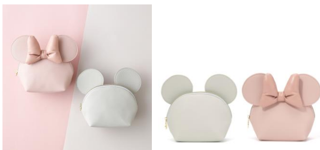
【商品名】ディズニー モチーフポーチ 【種類】グレー/ピンク 【価格】グレー：¥2,400/ピンク：¥2,500

くすみカラーが大人可愛いミッキー、ミニーのモチーフポーチです。ミニーのリボンは柔らかい合皮を使い立体的に仕上げ可愛さをプラスしました。