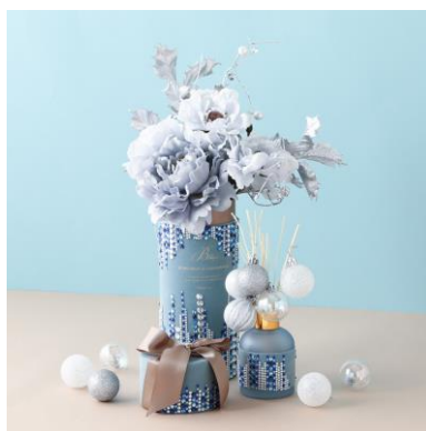
<会場には様々なデコレーションアイデアも登場>