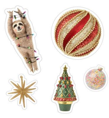
<SNS 投稿キャンペーンでもらえるイベント限定ステッカー>