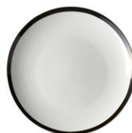
カーサセンス プレートL ホワイト ¥2,000