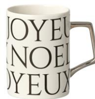
ノエル マグ ホワイト ¥900