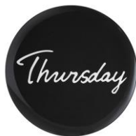
ウィークデイ&ウィークエンド プレート THURSDAY L ¥700