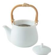
一汁一菜 ポット ¥2,700