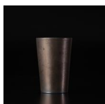
Masterrecipe タンブラー 陶器 M ブラック ¥2,000