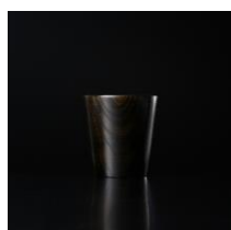
Masterrecipe タンブラー 木 S ダークブラウン ¥5,000