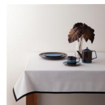
フレイミー テーブルクロス ホワイト 2000x1300 ¥4,800