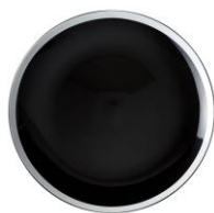
カーサセンス プレートL ブラック ¥2,000