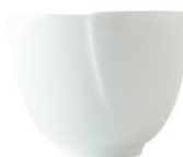
一汁一菜 煎茶 ¥432