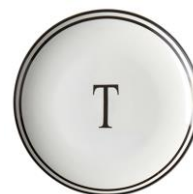
カーサセンス プレートM TEA ¥1,400