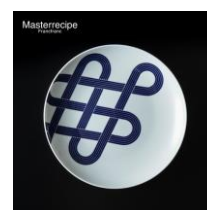
Masterrecipe 有田 大皿 結び L ¥3,200