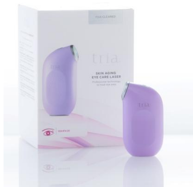
トリア・スキン エイジングアイケアレーザー 販売価格: 32,800円(税込)