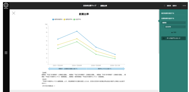
【福岡市の創業比率の推移(2001年～2012年)】 起業・創業の活発度合いを示す「創業比率」の推移を、全国平均や他の自治体と比較

例えば、起業・創業の活発度合いを示す「創業比率」の推移を、全国平均や他の自治体と比較することができます。さらに自らの自治体の創業比率は全国第何位なのかも把握できます。また、ランキング上位の自治体がどこかも把握できるので、それらの自治体がどのような創業施策を講じているかを調べて参考にすることができます。