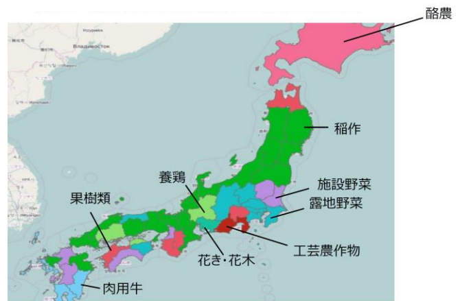
各自治体で販売金額の多い農業部門を地図上で表示したもの

これにより、広域な視点での農業振興策の検討や、農業経営者への効率的かつ効果的な経営支援等が可能になるほか、農地の有効活用策の検討や新規就農者の受け入れなどの検討に役立てることができます。