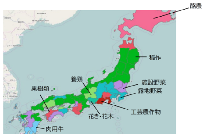
各自治体で販売金額の多い農業部門を地図上で表示したもの

これにより、広域な視点での農業振興策の検討や、農業経営者への効率的かつ効果的な経営支援等が可能になるほか、農地の有効活用策の検討や新規就農者の受け入れなどの検討に役立てることができます。