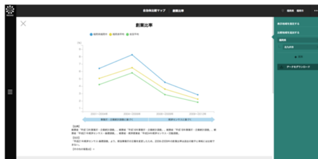
【福岡市の創業比率の推移(2001年～2012年)】 起業・創業の活発度合いを示す「創業比率」の推移を、全国平均や他の自治体と比較

例えば、起業・創業の活発度合いを示す「創業比率」の推移を、全国平均や他の自治体と比較することができます。さらに自らの自治体の創業比率は全国第何位なのかも把握できます。また、ランキング上位の自治体がどこかも把握できるので、それらの自治体がどのような創業施策を講じているかを調べて参考にすることができます。