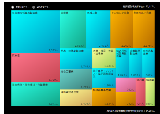
【石川県小松市の産業ごとの従業者数(事業所数)の割合(2014年)】 都道府県・市区町村単位で、企業数、従業者数、売上高、付加価値額等の産業別の割合を四角の大きさで表現。

自地域の経済を支える主要産業や域外からお金を稼ぐ産業、付加価値を多く生み出す産業の特定のほか、地域の所得水準の分析や地域における特許の集積状況、事業所の立地状況の推移等を把握できるデータを揃えています。また、地域経済を支えている「地域中核企業候補」を抽出することもできます(自治体のみ利用可能な「限定メニュー」)。都道府県・市区町村が地域経済産業政策を立てたり、複数自治体間で政策連携をしたりする際に役立てていただけます。